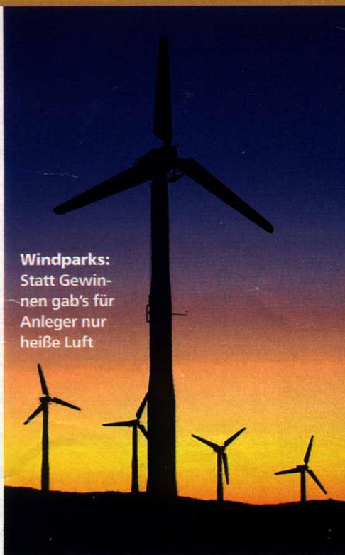
Windparks: Statt Gewinnen gab's für Anleger nur heiße Luft