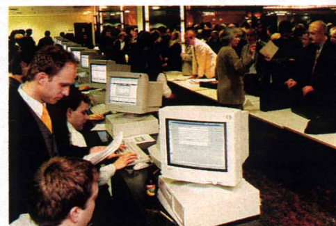
Gläubigerversammlung: Nach der Pleite meldeten sich rund 50 000 Geschädigte